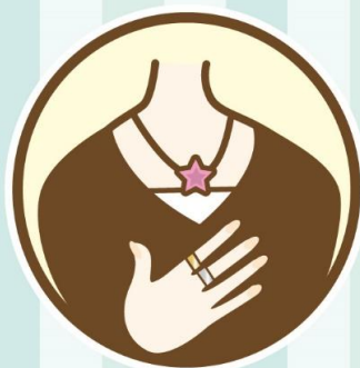
指輪・ネックレス

ヤオマサ株式会社は多様性ある社会の実現に向けて一歩を踏み出します。 お客様のご理解ご協力をお願い致します。