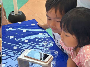
顕微鏡で乳酸菌チェック