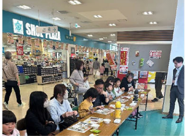
<グミソーダ作り>体験