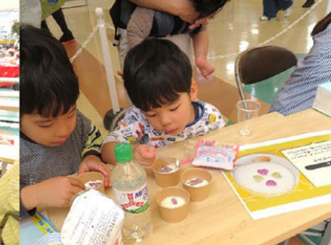
どのグミにしようかな