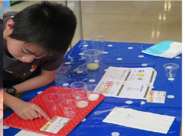
美味しさの秘密わかったよ！！