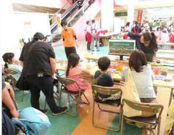
まずはクイズに挑戦