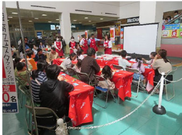
ビスコについて勉強しました オリジナルレシピでビスコ作り！！