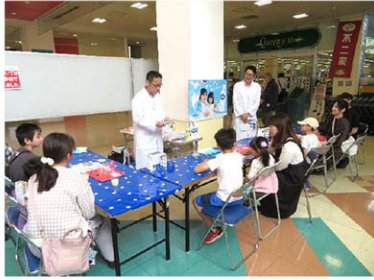
こちらは「乳酸菌勉強会」

約1年ぶりの開催です！！ プラスチック削減のお勉強！！ みんな真剣です！！ MYボトル完成です！！