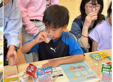
新しいグミの楽しみ方を知りました